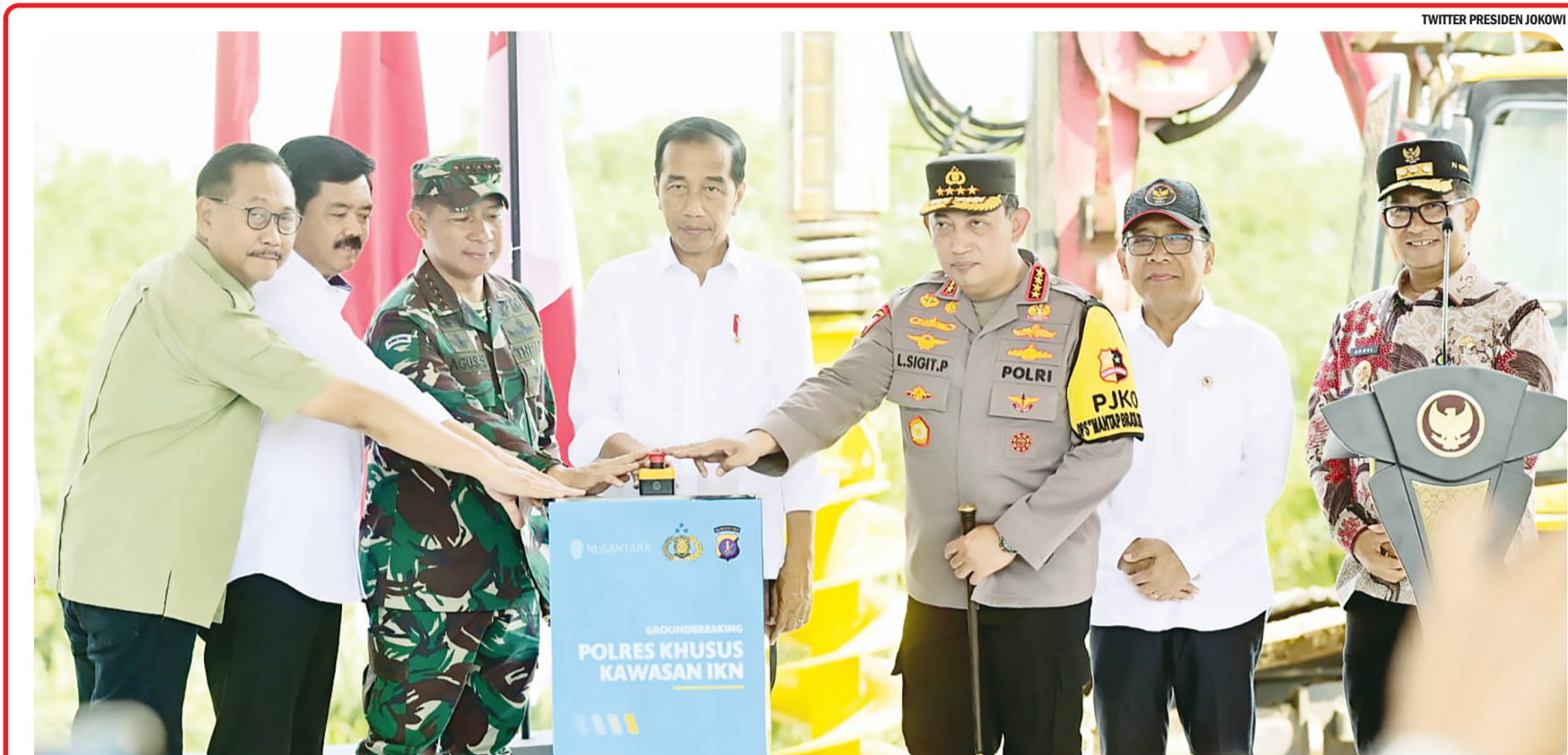
TWITTER PRESIDEN JOKOWI

HARGA ECERAN DALAM KOTA RP2500, LUAR KOTA+ONGKOS KIRIM